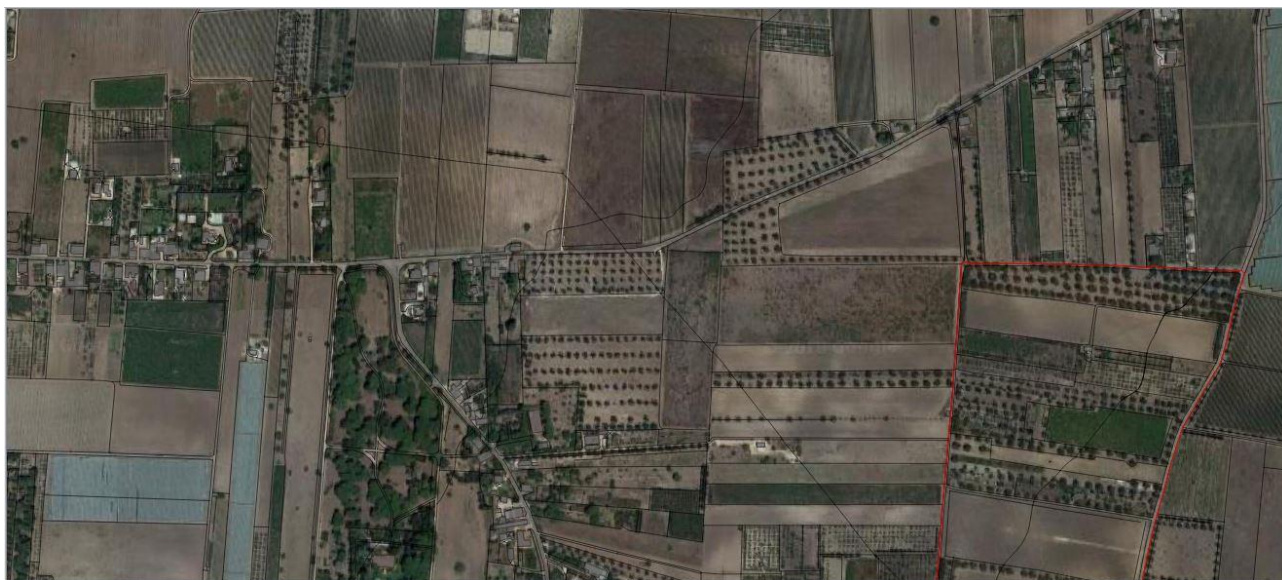
Casino Colella nel PPTR

Il Casino Colella in contrada San Donato nel territorio orientale di Taranto è ubicato sulla strada Talsano-Faggiano, in una zona caratterizzata da ulivi secolari. Il casino, che nel nome sintetizza l'origine di dimora stagionale della proprietà, comprende l'abitazione padronale, che affaccia su una corte chiusa, e gli impianti per la lavorazione delle uve e per la produzione del vino. La cappella, con facciata barocca, è accessibile anche dall'esterno ed è adiacente al blocco architettonico dell'appartamento padronale. Il complesso architettonico è inoltre caratterizzato da un sistema di ambienti ipogei per la raccolta delle acque piovane, per la conservazione del vino, ecc. Notevole interesse rivestono le colture arboree del giardino, prevalentemente alberi da frutta.