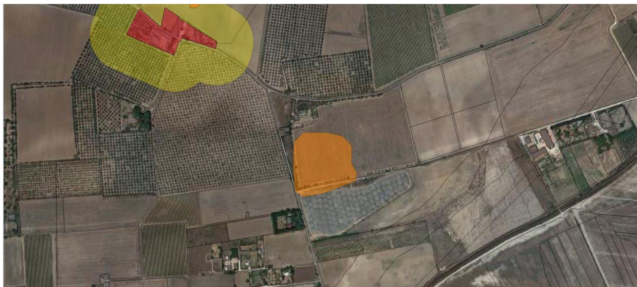
Galeone nel PPTR

Nell'area, oggetto di indagini topografiche di superficie, è documentata una continuità a carattere insediativo rurale dal VI secolo a.C. fino ad età imperiale, con attestazioni di una frequentazione neolitica nel settore più orientale, prospiciente il margine della Salina.