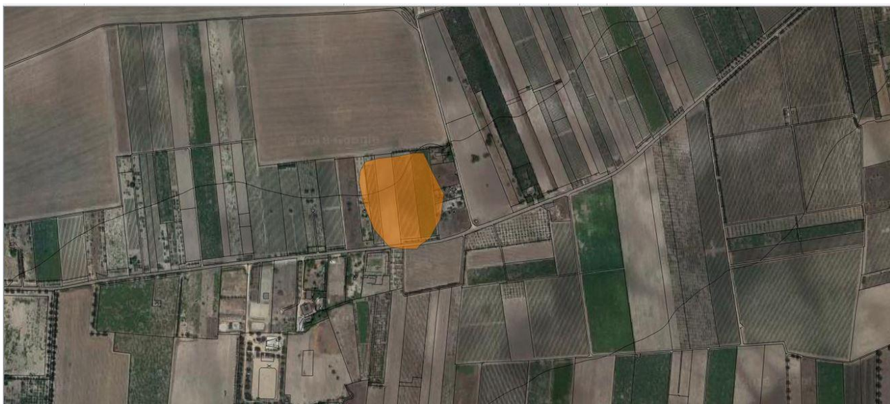
La Carducci nel PPTR

Il survey effettuato nel sito ha evidenziato una cospicua presenza di frammenti ceramici, riconducibili a due ambiti cronologici distinti: ad una frequentazione a carattere stanziale japigia rimandano i frammenti di ceramica matt painted . I frammenti di ceramica greca arcaica documentano interazioni e contatti con la polis , mentre la frequentazione del IV secolo è riferibile ad un insediamento rurale con annesso aree di necropoli.