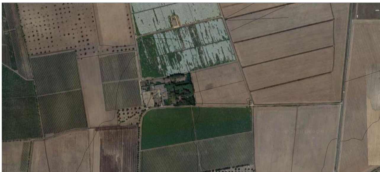
Masseria Nisi nel PPTR

La masseria, dotata anche di chiesa con accesso esterno e trappeto ipogeo, è ubicata nel territorio sud-orientale, al confine con il comune di Faggiano. Riportata nel Catasto Onciario del 1746 con la descrizione delle pertinenze, comprende la casa padronale separata, con muro e corte interna, dalle abitazioni destinate ai massari e ai coloni e dagli altri ambienti destinati alle lavorazioni e al deposito delle derrate.