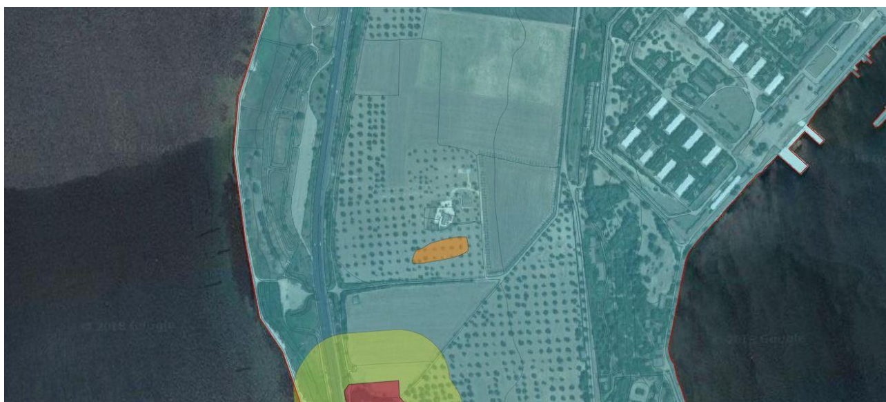
Scardante nel PPTR

Nei pressi della Masseria Scardante, nel corso di ricerche topografiche di superficie, sono stati individuati numerosi blocchi squadrati in carparo, una vera di pozzo, tegole, coppi, ecc. I frammenti ceramici raccolti sono riferibili ad un insediamento agricolo di IV secolo a.C.