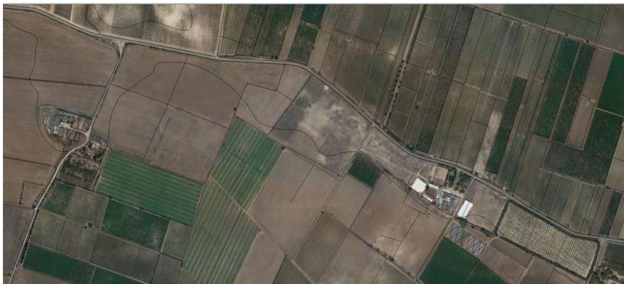
Il sito di Morrone Vecchio nel PPTR

Ricognizioni di superficie effettuate recentemente dalla Soprintendenza hanno confermato la presenza di un'ampia concentrazione di frammenti ceramici e di materiale lapideo, tra cui un frammento di colonna e vari frammenti di blocchi e lastre in pietra, estesa su un poggio appena rilevato adiacente al lato sud della strada provinciale Pulsano-Monacizzo, in località Morrone Vecchio.