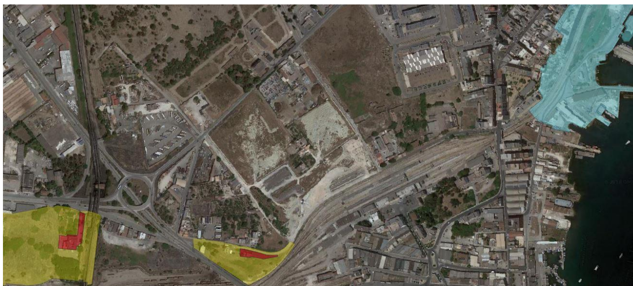
Il sito di Ruggiero-Croce sul PPTR

Le ricerche archeologiche condotte nell'area di Masseria Ruggiero, quali indagini propedeutiche alla creazione di un sistema integrato di linee veloci riservato al trasporto pubblico urbano e di parcheggi di scambio ad esse connessi, hanno fornito dati conoscitivi molto interessanti. Oltre a testimonianze di età preistorica (neolitico), sul pianoro antistante la masseria è stata individuata un'area di necropoli inquadrabile tra il IV e il III sec. a.C. Allo stesso periodo possono essere riferiti strutture e materiali connessi probabilmente con pratiche di culto.